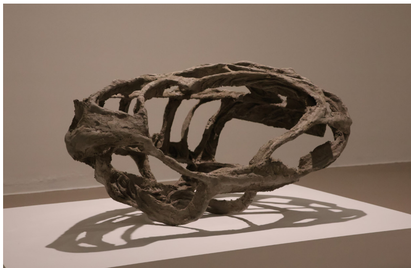
Mire Lee, Untitled, (Large Egg Skeleton) , 2026 Acier, béton. 60 x 70 x 110 cm Production Institut d'art contemporain, Villeurbanne/Rhône-Alpes

L'artiste développe une pratique sculpturale explorant les tensions entre corps, matière et technologie. À partir de matériaux industriels (béton, étais, turbines...) et de dispositifs mécaniques, elle crée des formes hybrides mêlant organique et artificiel, offrant au public une véritable expérience sensorielle et physique. Son travail interroge désir, vulnérabilité et transformation, à la frontière du biomécanique et de la sculpture contemporaine.