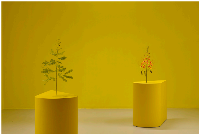
The Marias , 2020.