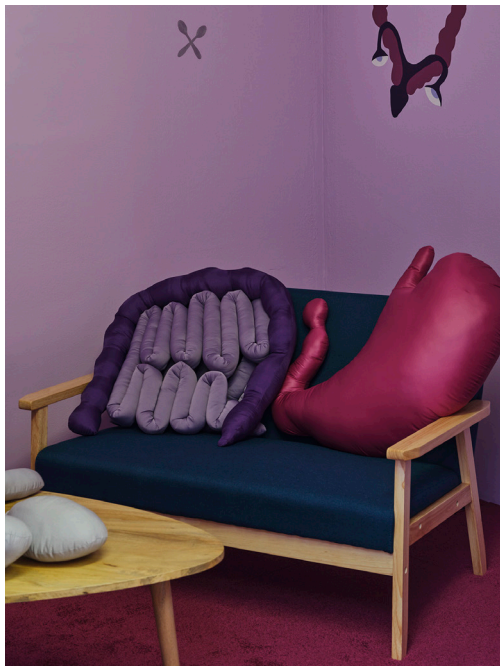
The Illness narratives (1-12), 2024-2025