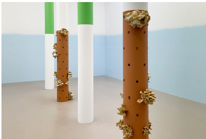
Pleurotus cornucopiae , 2020, Jérôme Dupeyrat et Laurent Sfar

Jouant de la rencontre et de l'inattendu, il introduit des perturbations dans le cours du réel pour ré-agencer de manière ludique nos territoires mentaux et spatiaux.