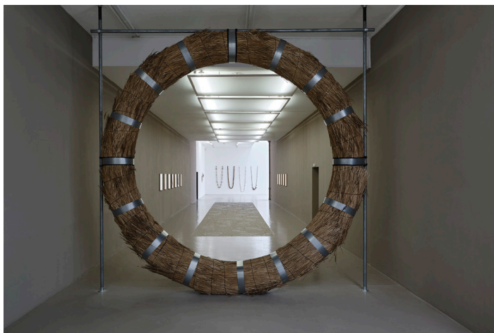
To Separate the Sacred from the Profane, 2016, Maria Loboda

L'artiste fonde son travail sur l'interprétation et la réappropriation de rituels de symboles propres aux différentes communautés. L'œuvre présentée ici, s'inspire des temples shinto au Japon où les fidèles sont invités à traverser les portes symboliques selon un parcours en 8 afin de se purifier.