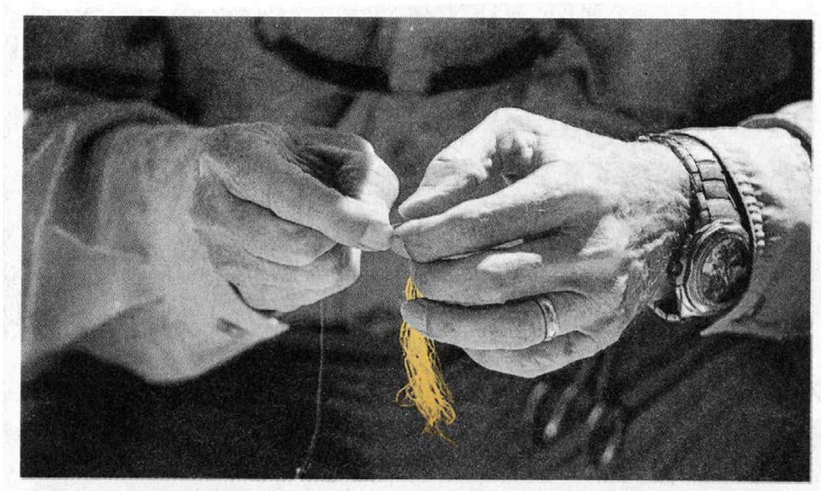
Evariste Richer, Le Grand horloger , 2017. © Artiste, collection IAC.