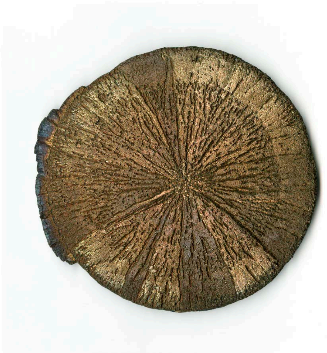
Evariste Richer, Soleil politique , 2017. © Artiste, IAC.